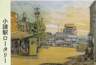
小諸駅ロータリー