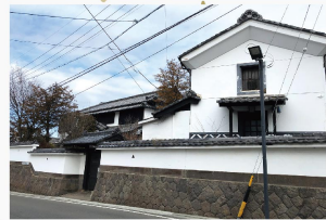
25、26日 旧ホテル小諸 建物公開！(売却可)

観光案内所集合 10時~12時 定員 20名 1000円(昼食込み) *昼食は「茶屋くめや」で名物おにかけうどん・コーヒー付き 要予約 ☎0267-22-0568 (観光案内所)