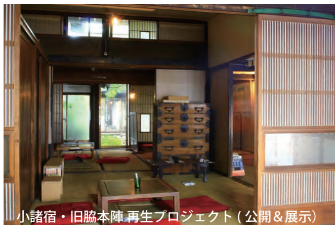
小諸宿・旧脇本陣再生プロジェクト (公開&展示)