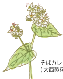
そばガレット (大西製粉)