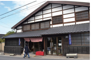
本陣主屋(江戸時代の建物を移築復元)

2 山謙酒造 「ほろよいマルシェ」 江戸の建物で、地酒、地ワイン等販売。おやすみ処&時々音楽あり。 「蔵出しアンティーク屋」 ご寄付いただいた古道具、古布、建具をお譲りします。(収益はフェスタの運営資金とします)