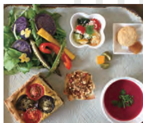
昨年のランチカフェ