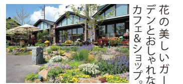
花の美しいガーデンとおしゃれなカフェ&シヨップ。

14 駐車場ガーデン 「小品盆栽&秋の苔玉」 愛好家による紅葉のミニ盆栽等の展示販売。多肉植物も豊富です。