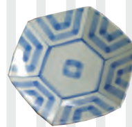
陶磁器 (陶房風遊舎)